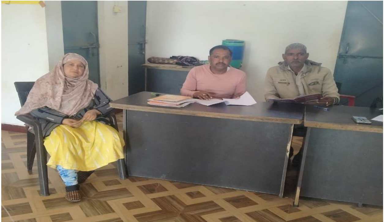
मतदान केन्द्र 136 बैडाबे